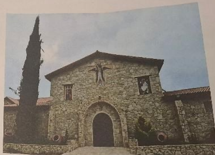
Ιερά Μονή Αρχαγγέλου Μιχαήλ, Μονάγρι Λεμεσός

Θ' ΕΠΑΡΧΙΑΚΗ ΗΜΕΡΙΔΑ ΛΕΜΕΣΟΥ ΜΑΘΗΤΙΚΕΣ ΠΕΡΙΗΓΗΣΕΙΣ ΣΤΑ ΘΡΗΣΚΕΥΤΙΚΑ ΚΑΙ ΠΟΛΙΤΙΣΤΙΚΑ ΜΟΝΟΠΑΤΙΑ ΤΗΣ ΚΥΠΡΟΥ